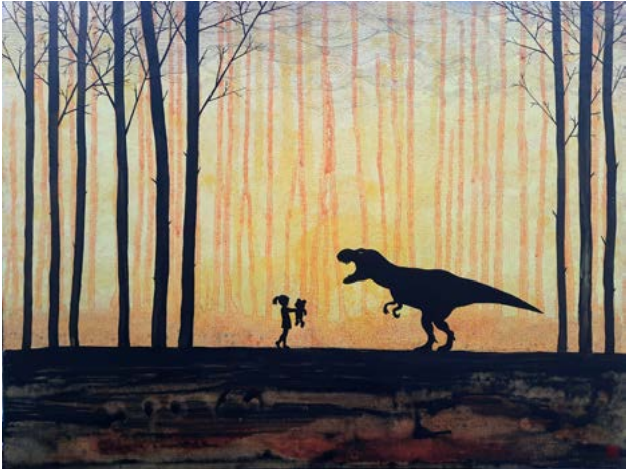
ELSŐ ÁLDOZÓ, 2021 vegyes technika, vászon, 60 x 80 cm