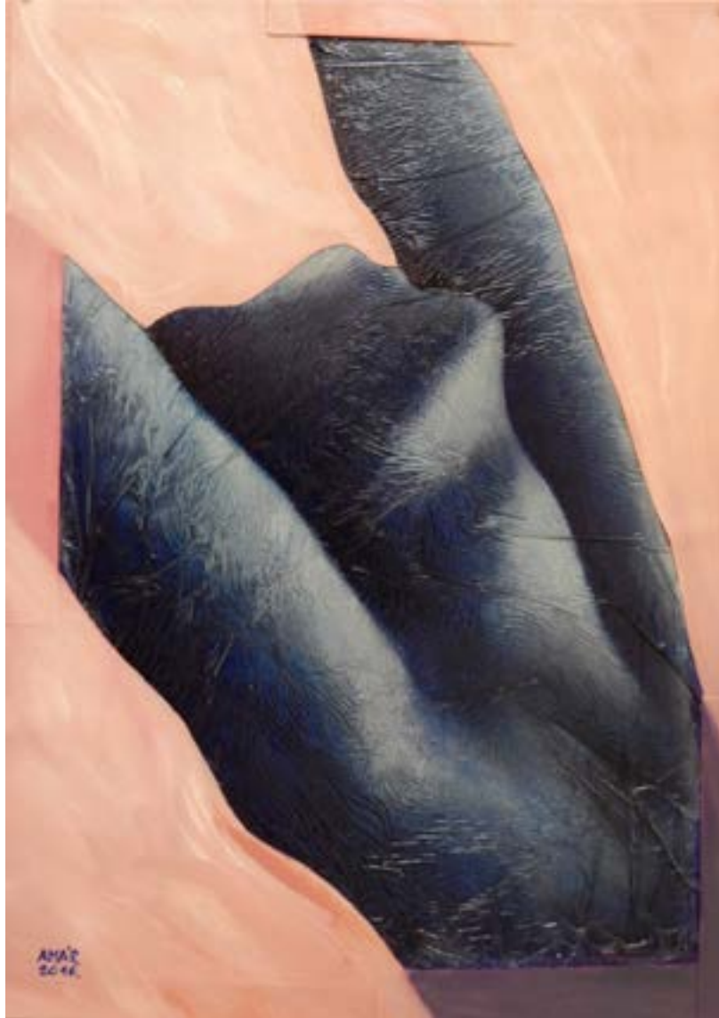
MOTÍVUM RODIN-TŐL II., 2020 Olaj, papír, celofán, 90 x 70 cm