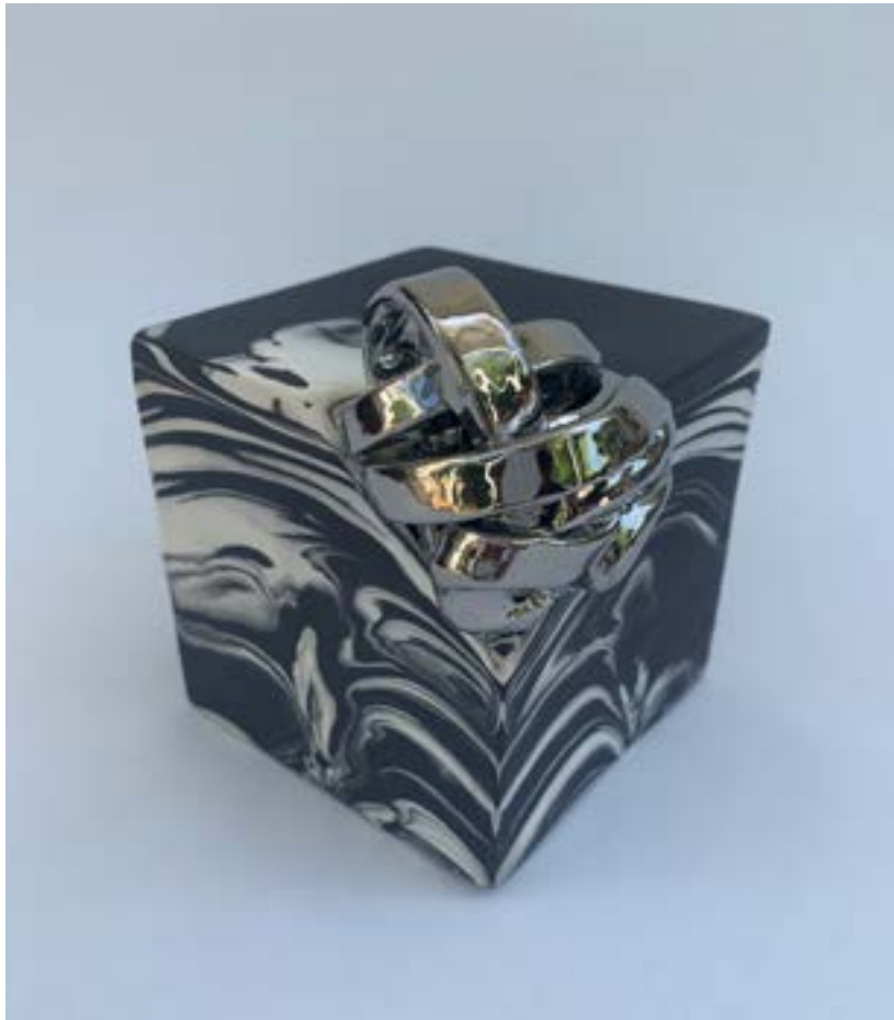
BUBORÉKOK, 2020 Porcelán kisplasztika, 40 x 15 x 25 cm