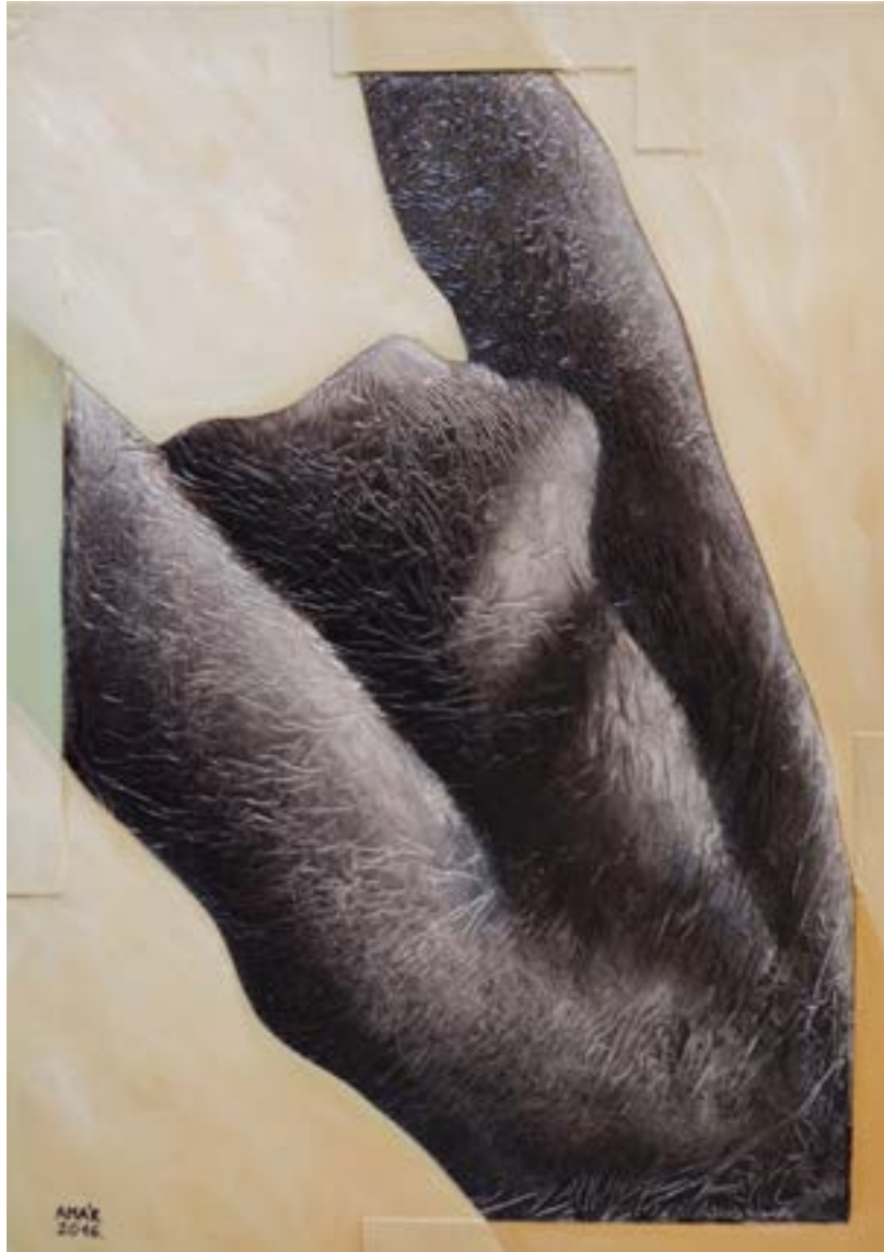
MOTÍVUM RODIN-TŐL III., 2020 Olaj, papír, celofán, 90 x 70 cm