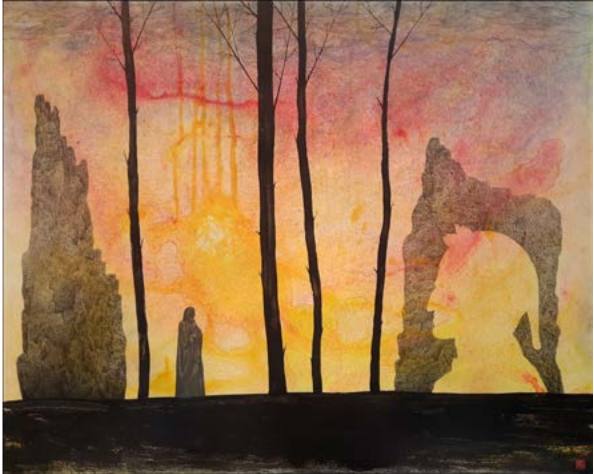
DIVINA COM. MEDIA, 2021 vegyes technika, vászon, 80 x 100 cm