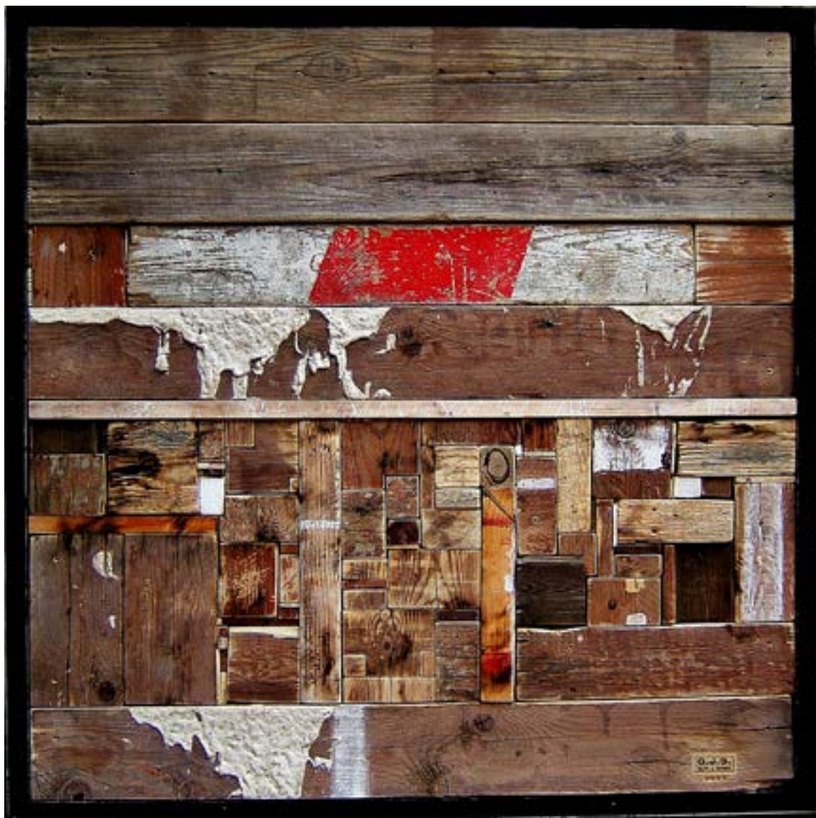
STRUKTÚRA III, 2011 festett fa, 95 x 65 cm