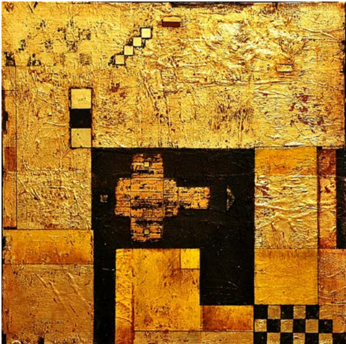
ARANYFAL, 2013 fa, arany metál, 80 x 80 cm