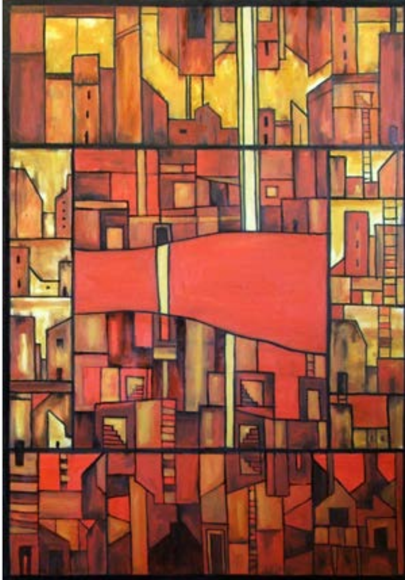
FÖLDALATTI VÁROS II., 2018 olaj, vászon, 100 x 70 cm