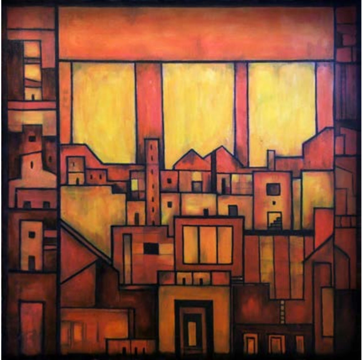
VÁROS-LABIRINTUS 9.B, 2020 olaj, vászon, 100 x 100 cm