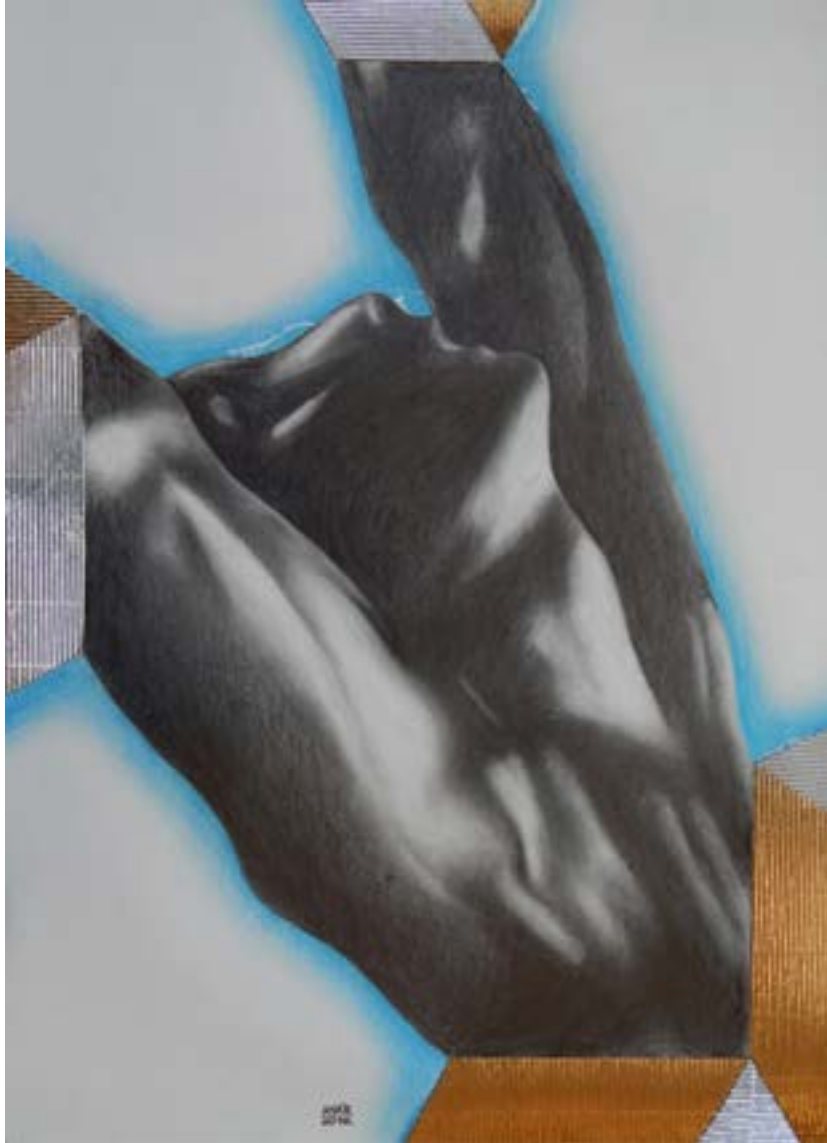
MOTÍVUM RODIN-TŐL I., 2020 ceruza, papír, műanyag, 90 x 70 cm