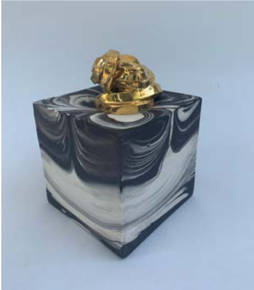
BEGUBÓZVA, 2019 Porcelán kisplasztika, 18 x 10 x 10 cm