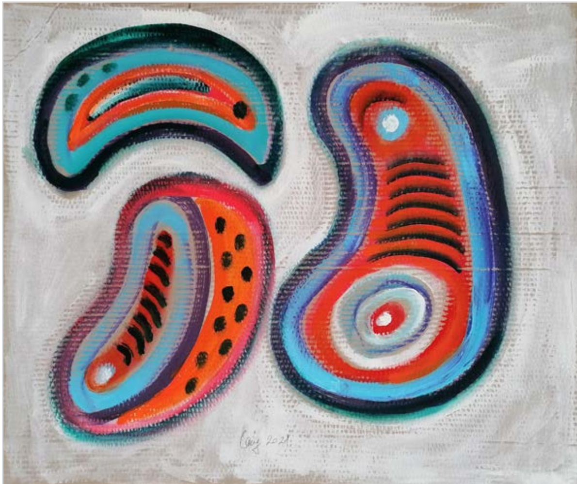
BŐSZÖRMÉNYI FORMÁK III. 2021, akril, karton, 60 x 70 cm