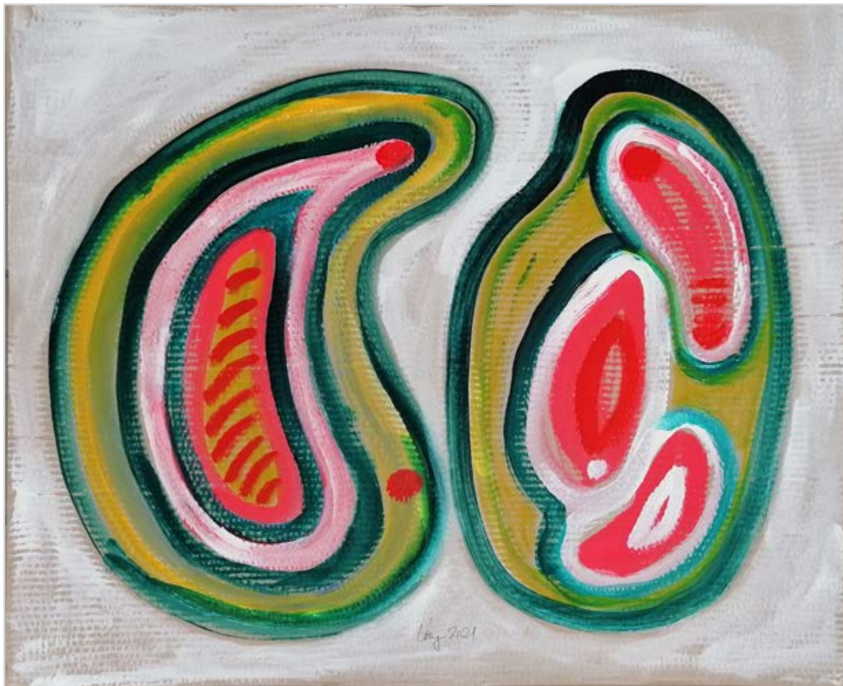
BŐSZÖRMÉNYI FORMÁK II. 2021, akril, karton, 60 x 70 cm