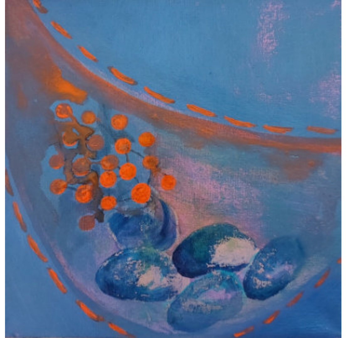
HAJNALI KÖDFAL SOROZAT, ZSEB akril, vászon, 20 x 20 cm, 2024