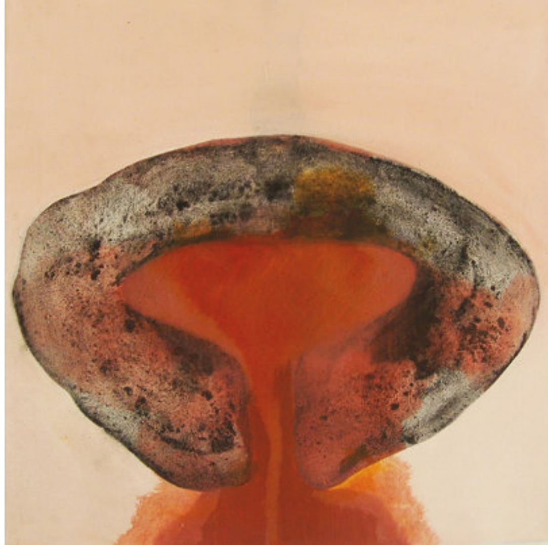
ANTROPOMORF SOROZAT, FOLYO vegyes technika, vászon, 50 x 50 cm, 2014