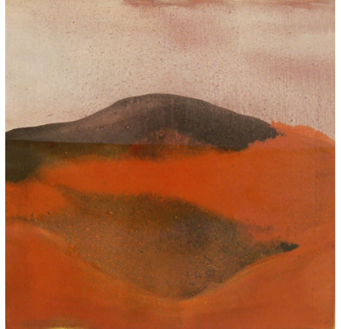
ANTROPOMORF SOROZAT, KÖD vegyes technika, vászon, 50 x 50 cm, 2014