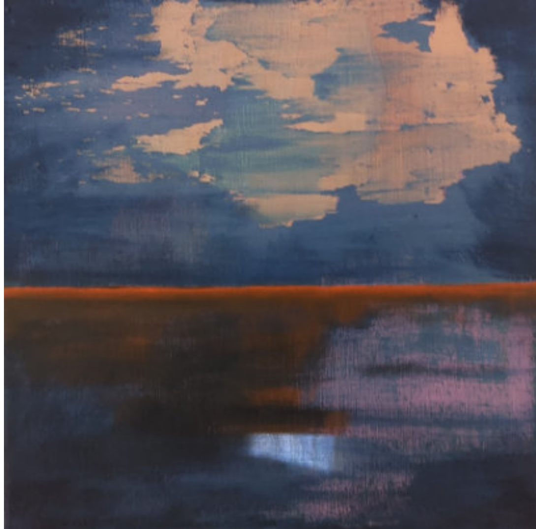
HAJNALI KÖDFAL SOROZAT, VIZ akril, vászon, 20 x 20 cm, 2024