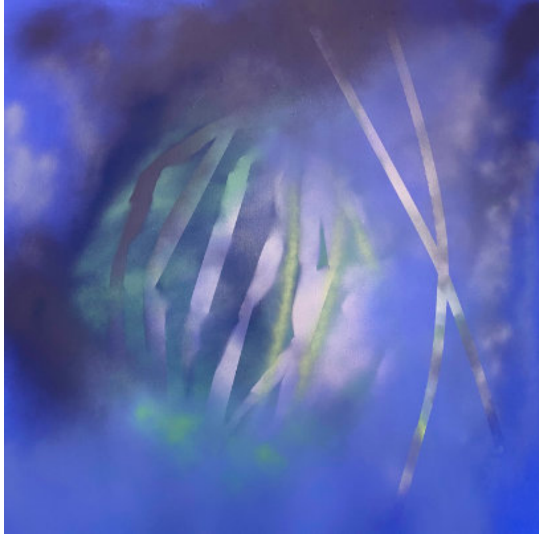
GET INTO NATURE BIOMIMICRY vegyes technika, vászon, 100 x 100 cm, 2023